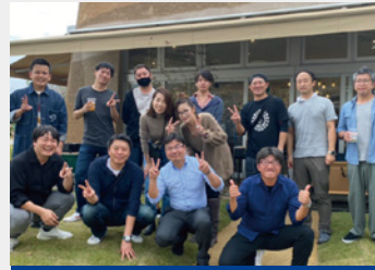
新入会員向けイベント

会員が得意分野を生かして講師となり、会員向けに勉強会を行う「YEG学園」を開講。