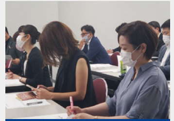
経営セミナー開講

観光促進のため、御楼門周辺の散策情報を、無料ダウンロードできるマップや360度動画で紹介。